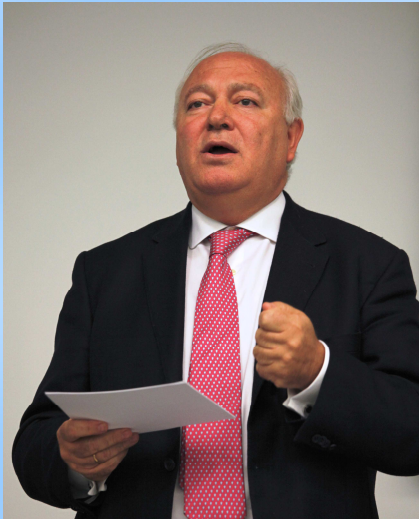
Miguel Angel Moratinos

Los Ministros Bernard Kouchner , Miguel Ángel Moratinos y Charles Michel abogaron por un impuesto sobre las transacciones financieras para el desarrollo.