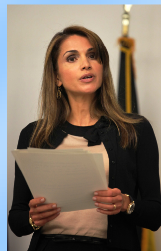
Reina de Jordania

El evento organizado por el Grupo Piloto y abierto a las misiones permanentes, las ONG, las organizaciones internacionales, las fundaciones, los laboratorios de ideas y la prensa, fue presidido por los señores Seiji Maehara (Ministro de Asuntos Exteriores de Japón), Bernard Kouchner (Ministro de Asuntos Exteriores de Francia), y Charles Michel (Ministro de Cooperación para el Desarrollo de Bélgica). La inauguración estuvo a cargo de la Reina Rania de Jordania . Durante casi tres horas, el evento reunió a más de 500 participantes , entre los que destacan numerosos ministros y los principales especialistas en el ámbito de los financiamientos innovadores: